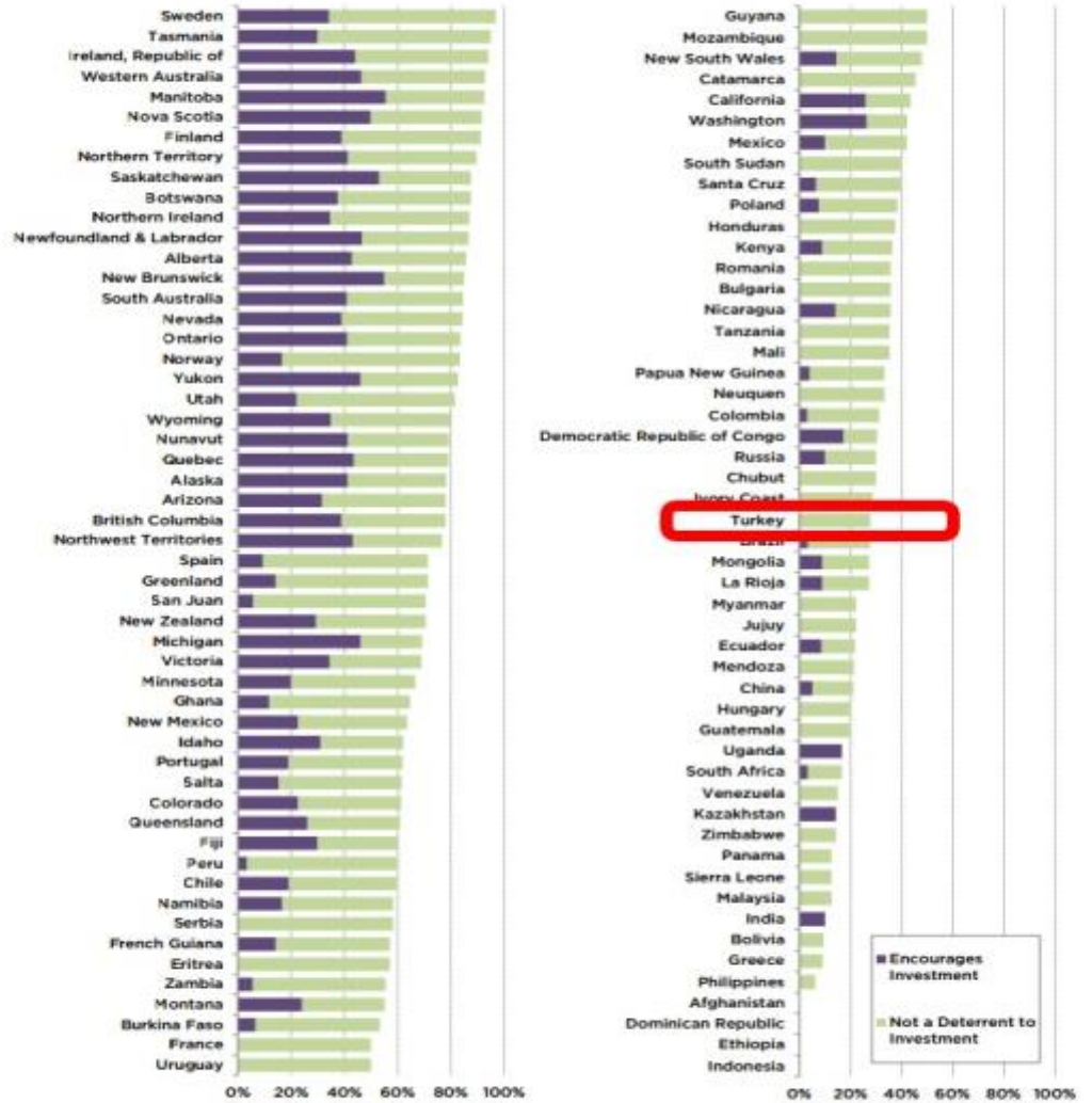
Figure 18: Legal System