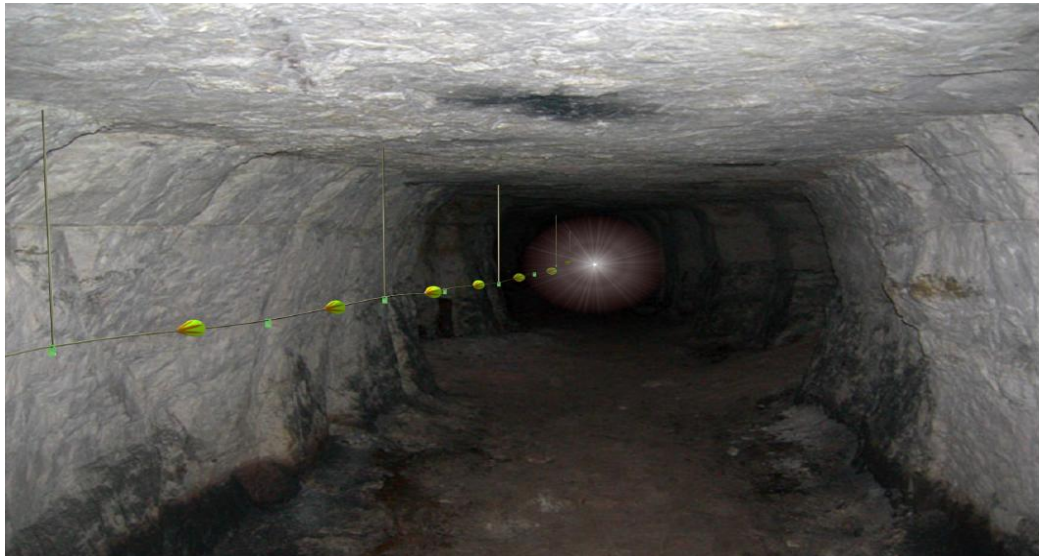
Şekil-Hata! Yer işareti tanımlanmamış.: Hayat hattı görünümü

"18. Yeraltı madenlerinde, hazırlık faaliyetlerinin yapıldıđı alanlar ve üretim panoları gibi yeraltı maden işletmesinin bütün bölümlerini kapsayacak şekilde ve çalışanların yerüstüne çıkmalarını kolaylařtıran; yanmaya, kopmaya ve aşınmaya karşı dayanıklı bir hayat hattı kurulur (Şekil-1 ve Şekil-2). Bu hatlar acil durum planlarına uygun olarak yerleřtirilir.